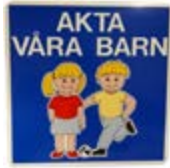
29850 Helreflekterande skylt "Akta våra barn" 600x600 mm