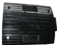
11510 Guppet Svart

Guppet läggs direkt på asfalten och bultas vid behov fast med 2 st asfaltbultar per sektion. För att guppet ska synas bra under dagtid lägger man varannan sektion gul/svart. För att synas i mörker är varje sektion försedd med två "kattögon" åt varje håll.