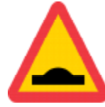
A9-1NOBX Vägmärke A9-1 "Varning för farthinder". Helreflekterande