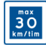
TTV66BX Vägmärke E11, "Rek. lägre hastighet". Hel-reflek- terande