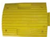
11510-1 Guppet Gul