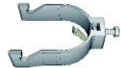
33093 BX klammer 60 mm med fjäderbricka